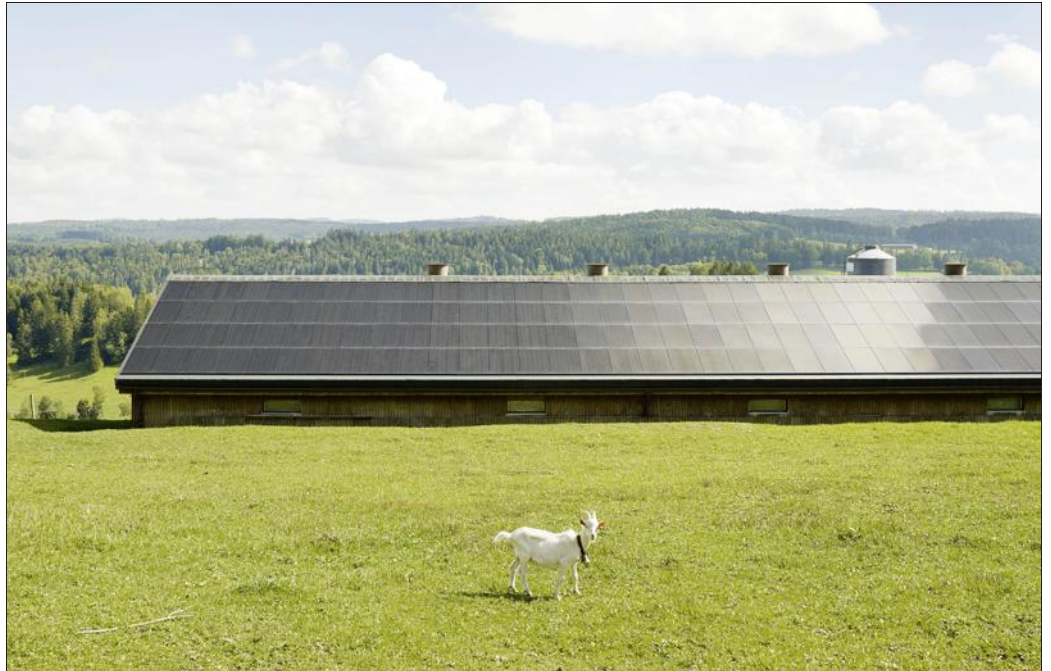
Une vision du paysage made in Henrik Spohler.

Carte blanche mais un objectif : tirer le portrait du Parc du Doubs. 25 clichés sont présentés. L'expo est accompagnée