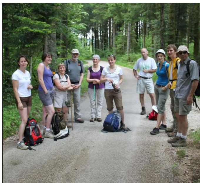
L'équipe d'organisation repère les trois parcours de la randonnée du dimanche 23 juin.

A la colonie de Noël-Cerneux, les bénévoles préparent activement la 15 e Marche organisée par l'Association « Etoile Saint-Ferjeux »