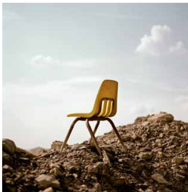
2007 © Daniel Shea