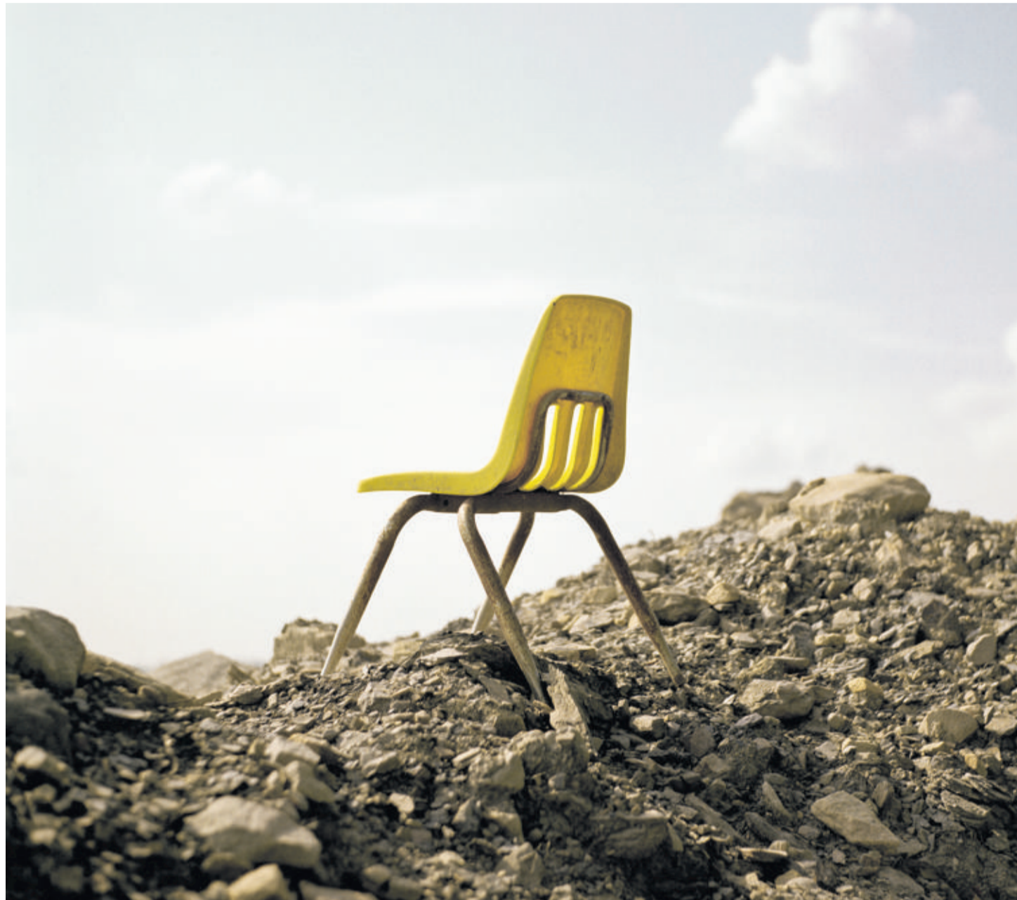
Image issue de la série «Removing Mountains» de Daniel Shea, résultat d'une enquête sur l'industrie du charbon dans les Appalaches. D.SHEA

Le cadre, qui fait presque partie de l'exposition, se prête parfaitement à l'événement, d'autant plus que ce sont les habitants de Rossinière qui mettent à disposition leurs propriétés. Granges, fermes et stands de tir deviennent les lieux d'exposition qui présentent des artistes suisses et internationaux. Loin du White