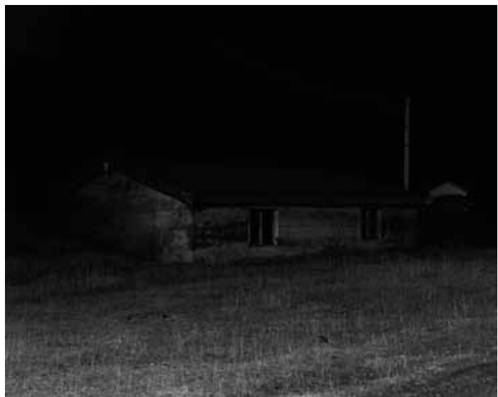
Awoiska van der Molen, Untitled , 2009

Awoiska van der Molen crée en solitaire. Avec la série Terra di Dio , débutée en 2009, elle nous emmène dans des paysages montagneux situés en Espagne (les Pyrénées, la Sierra Nevada), en