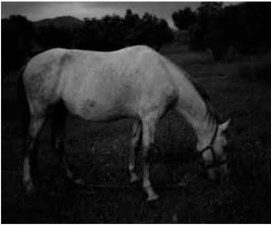
Awoiska van der Molen, Untitled, 2010

Italie (la Sicile) et en Norvège (Fylke). Seule dans la nuit noire, loin de la vie urbaine, la photographe tente de retranscrire l'intensité des atmosphères nocturnes, à la dimension quasi auratique. Dirigeant son appareil photo vers le sol, travaillant sous la lumière de la lune, la photographe explore sa relation à la terre et nous livre une réflexion sur les origines. Les photographies de montagne d'Awoiska van der Molen – des tirages qui frappent par le rendu subtil en noir et blanc – évoquent non seulement une expérience physique, mais questionnent aussi la quête du sublime.