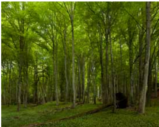
Olaf Otto Becker, Forêt, région de Montreux , mai 2011