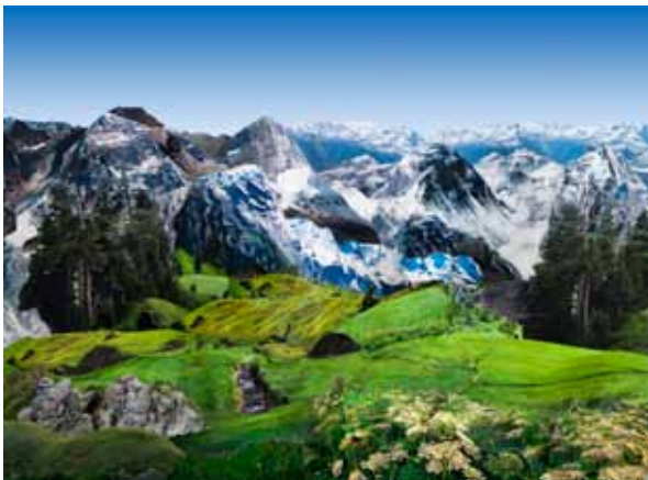
Justine Blau, The Circumference of the Cumanán Cactus 6 , 2010