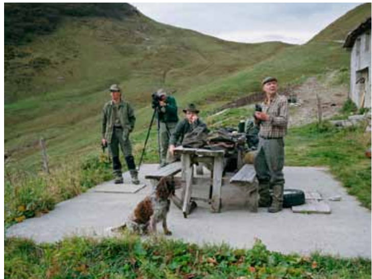
Anne Golaz, Les chasseurs aux aguets, 2010

Suite à une formation à l'Ecole de photographie de Vevey (CEPV), Anne Golaz (1983, Suisse) poursuit actuellement sa formation de photographe à l'Université d'art et de design d'Helsinki, en Finlande. Lauréate de la septième Enquête photographique fribourgeoise, la photographe a ainsi réalisé son premier projet d'importance, qui a également donné lieu à une publication aux éditions Infolio.