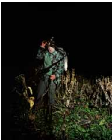
Anne Golaz, Le chasseur de chamois, 2010

La série Chasses (2010) est le fruit de ce projet qui a mené Anne Golaz sur les traces de chasseurs entre le canton de Fribourg et l'Alsace entre septembre 2009 et février 2010. Une belle mort se focalise sur la courte période de la chasse haute, qui ouvre la saison au début de l'automne. Le mythe de la chasse se joint à celui de la montagne, idéal de grandeur et de pureté, pour créer un monde illusoire extraordinaire empli de rituels et où la mort devient un acte sacré et justifié. Anne Golaz nous livre des images oscillant entre le documentaire et la mise en scène, pleine de rites, d'histoires et de personnages. Entre théâtralité et réalisme, fascination et répulsion, tradition et contemporanéité, ses photographies proposent ainsi un regard contemporain sur un thème traditionnel de la peinture, la scène de chasse.