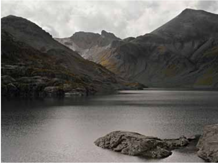
Matthieu Gafsou, Lac de retenue, Vieil Emosson, automne 2009

actuelle pour un retour à l'authenticité provoque le développement d'un nouveau type de tourisme en quête de contrées vierges et reculées. Cependant, cette quête met en péril ces étendues sauvages pour les assujettir à leur tour et les merchandiser. La montagne n'est-elle pas un excellent exemple de ce paradoxe ? Entre photographie artistique et documentaire, sacré, profane et identité nationale, les images de la série Alpes confrontent les panoramas empreints de sublime aux clichés de touristes et d'infrastructures qui leurs sont dédiées.