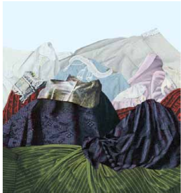
Ute Klein. Drapery Relief / simultaneous Prospect , 2011