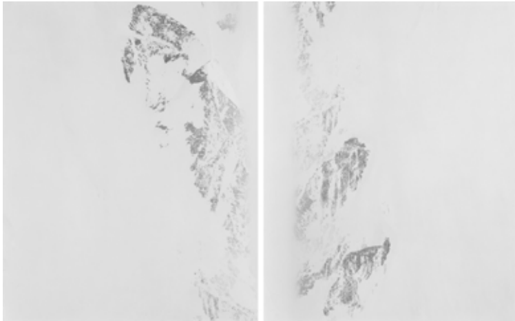
Marion Burnier, Dichotomique , dyptique, 2011