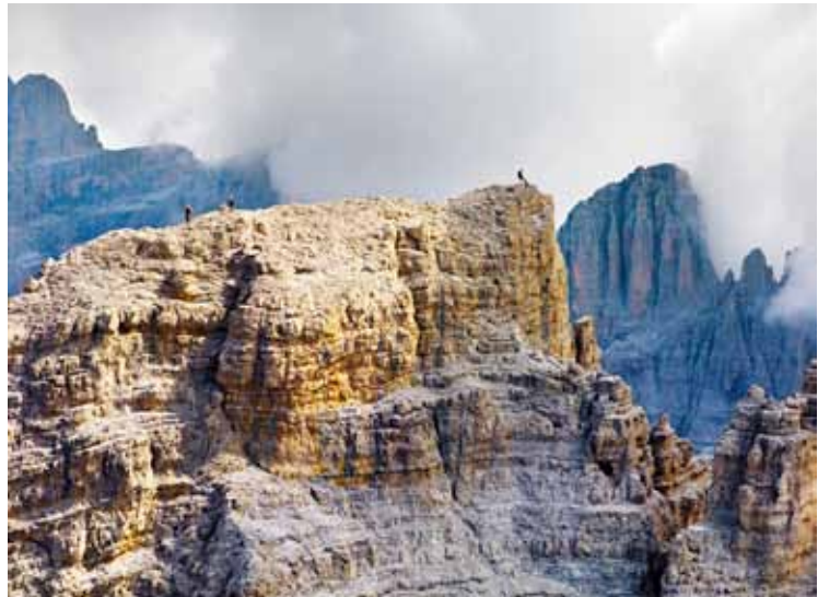
Olivo Barbieri, Untitled. De la série Dolomites Project , 2010

En photographiant les Dolomites, chaîne de montagnes de l'Italie du Nord, Olivo Barbieri a décidé de traiter le paysage naturel à la manière du paysage urbain. A ses yeux, la montagne présente une architecture comparable à celle des villes. Ses jeux d'échelle et de mise au point inscrivaient la série Site Specific dans une atmosphère surréaliste – réelle et mystérieuse à la fois. Avec Dolomites Project , le photographe réalise que la main de l'homme – c'est-à-dire l'architecture de la ville – est comparable à « un spectacle qui a remplacé virtuellement le sublime ». La montagne et la ville sont traitées de manière similaire car Barbieri comprend que la nature ne peut être contemplée sans prendre en compte l'impact de l'homme sur elle. Le travail du photographe encourage une réflexion sur l'environnement et la viabilité écologique de ces paysages qui demeurent extraordinaires. La série Dolomites Project a été réalisée avec l'aide de Trentino Marketing, Mart Rovereto, provincia autonoma di Trento.