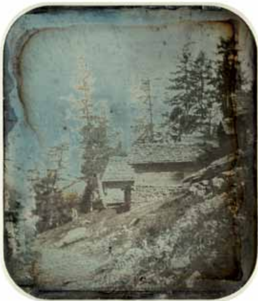
Girault de prangey, Chalets dans les Alpes , 1845-1850