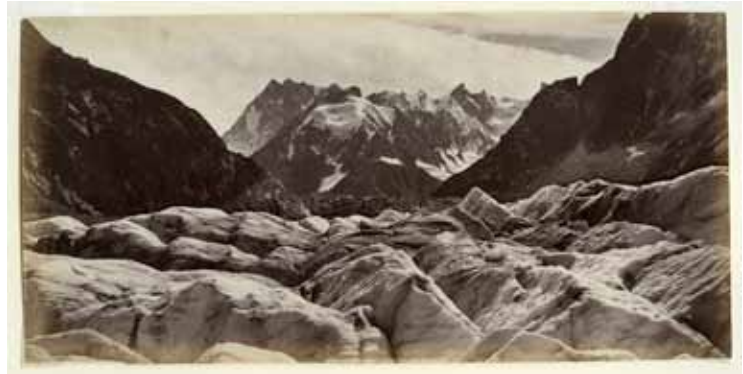
Francis Frith, Mer de Glace, le mont Blanc, vers 1860

Afin de montrer l'origine de la photographie de montagne, les festival Alt. +1000 présente une exposition de photographie ancienne, qui tient lieu de préambule aux travaux contemporains. Une place toute particulière est donnée aux tirages du photographe anglais Francis Frith (1822-1898), renommé pour ses voyages photographiques effectués entre 1856 et 1860 entre l'Égypte et la Palestine. Passionné de voyage dans la grande tradition britannique, Frith s'est rendu quelques années plus tard dans les Alpes pour y lancer le projet Swiss Views (1865 – 1885). Si au XVIIIe siècle le genre du paysage s'inspire de l'observation directe de la nature, au XIXe siècle ce sont les sentiments de fascination et d'émotion qui sont mises en avant par les artistes, sensibles aux sensations visuelles fortes ressenties face aux reliefs alpins. Les photographies de montagne de Frith sont empreintes d'une force mystique, entre pittoresque et sublime.