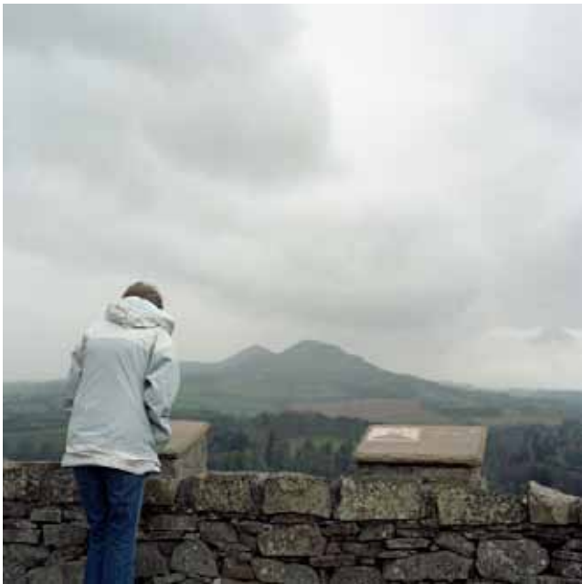
Jolanta Dolewska, Untitled, 2009