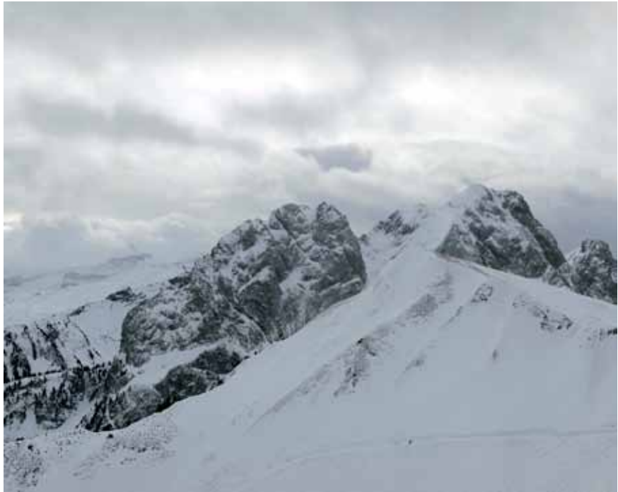
Olaf Otto Becker, Deux skieurs, Gummfluh , janvier 2011

Les tableaux photographiques d'Olaf Otto Becker ont pour principal sujet la nature. Cependant, la présence humaine est perceptible. On en décèle ici et là quelques traces, tels ces skieurs que l'on devine sur ce pan de neige. Semblant capturer l'air, l'atmosphère et la lumière, les images de Becker sont empreintes d'authenticité tout en s'inscrivant dans la tradition du sublime qui caractérise les paysagistes américains.