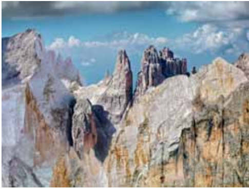
Olivo Barbieri, Untitled. De la série Dolomites Project , 2010