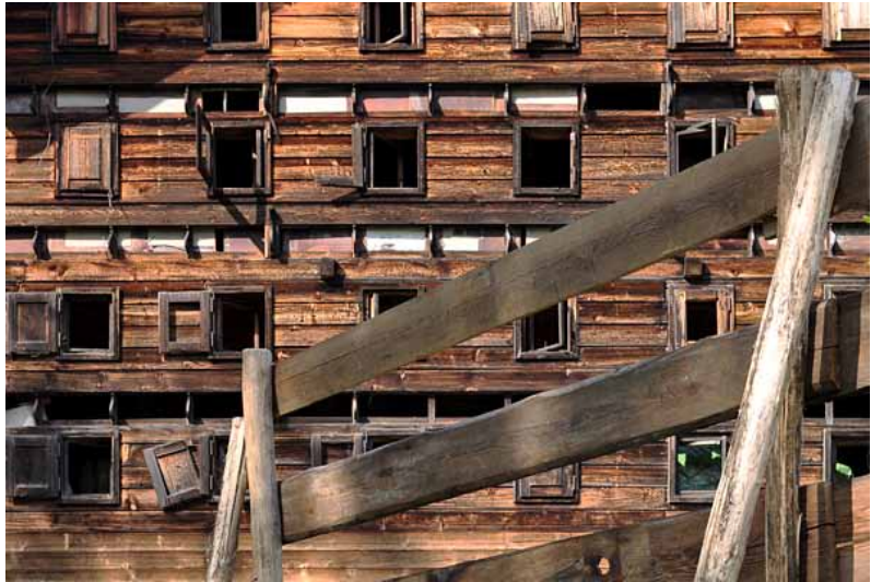
Studio A, Rossinière. De la série Zerfall , 2011

Contraints à quitter les alpages, les hommes et le bétail se dirigent vers la vallée lors de la désalpe. La vie quitte les monts et l'hiver s'installe. A la fonte des neiges, la vie réinvestit peu à peu les chalets d'alpage, pourtant certains demeurent abandonnés et attendent leur dislocation. Le chalet d'alpage représente un monde en disparition, de par ses traditions mais aussi en raison de sa précarité. Studio A livre pour le festival Alt. +1000 une installation et une réflexion sur le village de Rossinière. Un rucher marqué par les aléas climatiques est délaissé par ses abeilles. Des barrières, dont la fonction est de protéger la population contre les avalanches, subissent les aléas de la météo et les assauts du temps, en attendant leur dislocation complète. Zerfall montre l'abandon et la désintégration d'objets et de symboles culturels auxquels nous restons très attachés et les plonge dans un espace-temps intemporel.