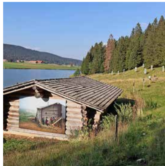
Sur une façade du chalet, une œuvre de Natela Grigalaskvili montrant une région agricole isolée et pauvre de Géorgie.

preinte. Une ville fait partie d'un paysage. Ce dernier peut être beau ou laid mais aussi fragile. Il peut faire peur. Les artistes qui exposent n'ont pas la prétention de changer les choses, mais tout au plus d'aborder ce qui fait notre quotidien avec un regard différent, d'entrevoir de nouveaux horizons.